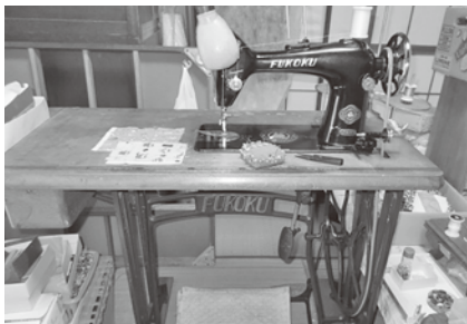
▲愛用の足踏みミシン

「近所の方をはじめ、皆さんに優しくしてもらいたい」と笑顔でお話してくださいました。