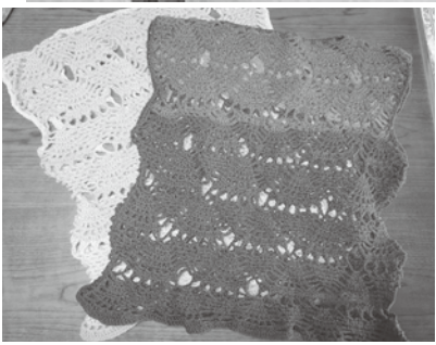
いせさん手作りのチョッキ