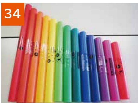
34 ドレミパイプ(2セット)