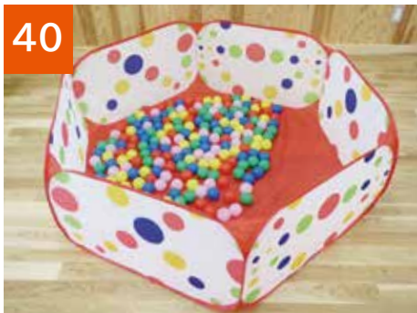
ボールプール(1セット)