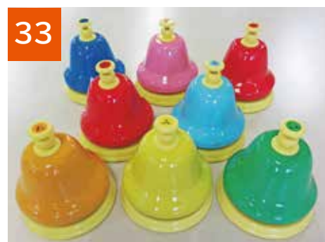
33 ベルハーモニー(1セット)