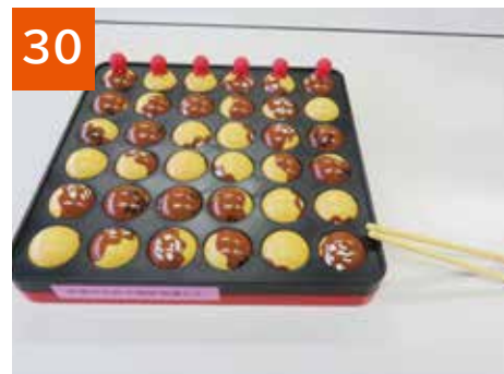
30 たこ焼きりばあし(2セット)