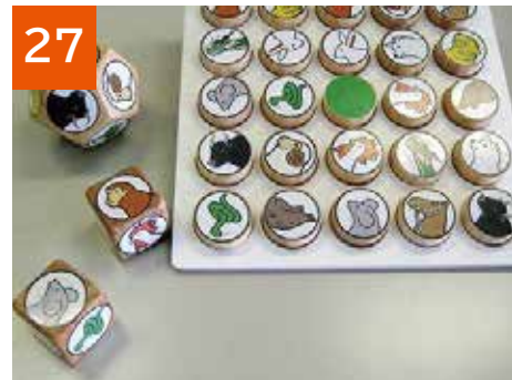
27 十二支ビンゴ(2セット)