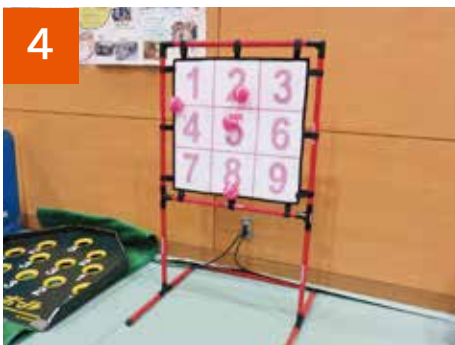
4 マジックナイン(2セット)