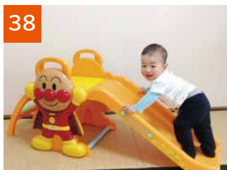
38 アンパンマンすべり台(1セット)