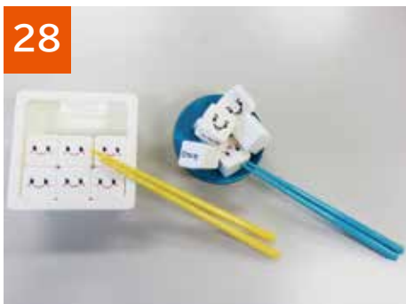
28 マナー豆富(2セット)