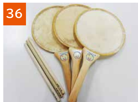
36 うちわ太鼓(3セット)