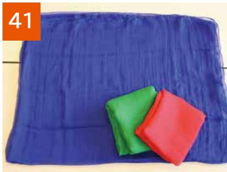
リトミック大判シフォンスカーフ(青・赤・緑)