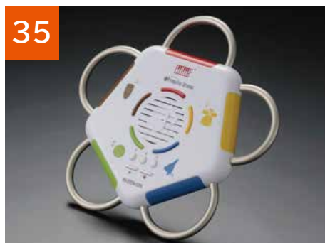
35 ふれあいドラム(5個)