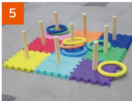
5 どこでもわなげ(1セット)