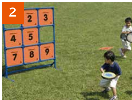
2 ディスゲッター9(1セット)