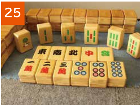
25 コミュニケーション麻雀(1セット)