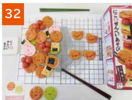
32 にこせんべいあそび(2セット)