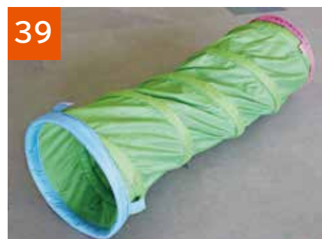
39 プレイトンネル(2セット)