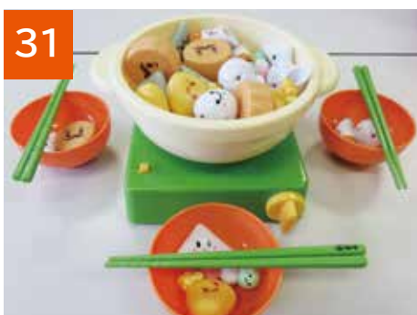
31 おでんマナー鍋(2セット)