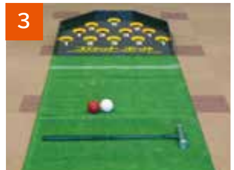
3 スカットボール(3セット)