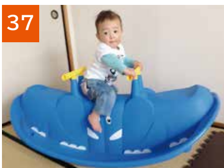
37 シーソー(赤・青 各1セット)