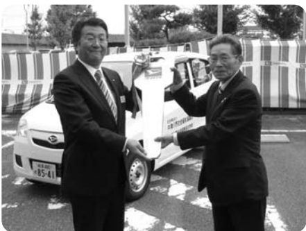
▲地域福祉活動のために活用させていただきます

社団法人生命保険協会では、全国的な取り組みとして地方生命保険協会加盟各社の職員等を対象に募金活動を実施し、集まった資金をもとに、地域のニーズや環境に応じた活動を展開しています。この福祉巡回車の寄贈もこうした活動の一つです。