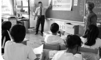
下野小学校（点字教室）