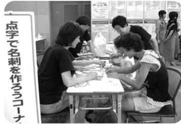
▲点字で名刺を作ったよ