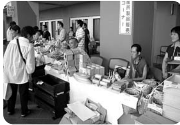
▲ご購入ありがとうございました