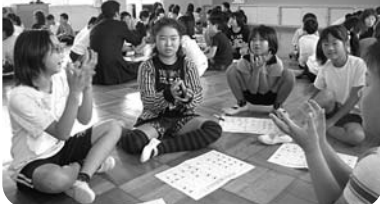
付知小学校（点字教室）