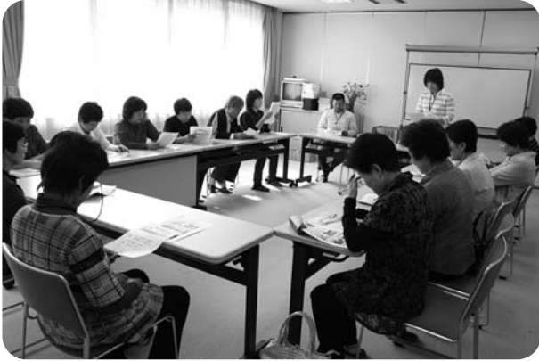
▲加子母支部と蛭川支部の交流の様子