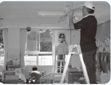
▲阿木保育園清掃活動