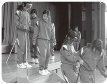
▲声での誘導が大切です

「視覚障がい者の方の大変さがわかった。」「目が見えないことがこんなに怖いと思わなかった。」「という生徒の感想発表の後、講師から「町で白い杖の方をみかけたら声をかける勇氣をもってください。」とアドバイスをいただきました。