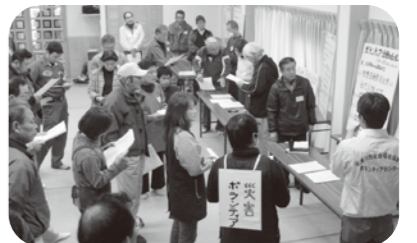
▲災害時には地域住民の助け合いが大切です

この訓練には、落合地区だけでなく、地域の防災に関心のある方を含め150人以上が参加し、防災に関する知識や災害時の対応について熱心に学んでみえました。