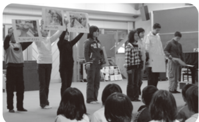
▲写真パネルでわかりやすく発表

総合学習では「高齢者疑似体験」や老人クラブ、デイサービスを利用する高齢者との交流等、福祉の現場で体験学習を行いました。こつした学習で学んだことや、感じたこと等を保護者や下級生にわかりやすく伝えるために寸劇にまとめ、1年間の集大成とも言える発表会となりました。